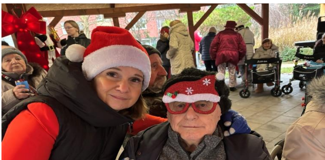
Vánoční trhy Modřice