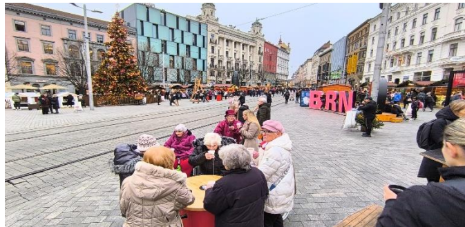
Vánoční trhy v Brně