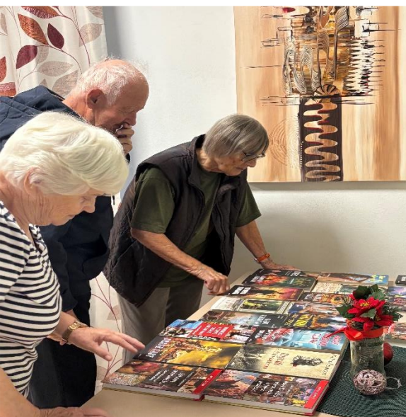
Sbírka dětských knížek