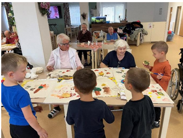
Děti z MŠ Modřice

V našem domově pro seniory se opět uskutečnilo pravidelné a velmi oblíbené setkání s dětmi z Mateřské školy Modřice. Během programu se tvořilo, zpívalo, povídaly se pohádky a příběhy. Naši klienti mají tuto aktivitu velmi rádi a vždy se na ni těší. Stejně tak i děti si společně strávený čas užívají, přirozeně navazují kontakt se seniory a s radostí s nimi sdílejí hudbu i vyprávění. Tato krásná aktivita je součástí mezigeneračního setkávání, které obohacuje obě generace a vytváří přátelskou a srdečnou atmosféru.