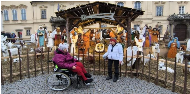
Vánoční trhy v Brně