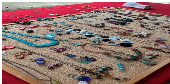
Vánoční trhy Modřice