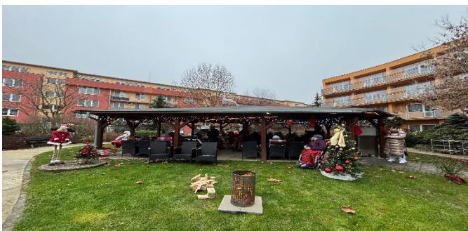
Zahrada – Senevida Modřice