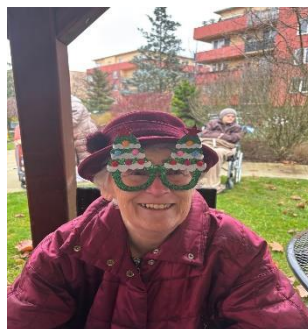
Vánoční trhy Modřice