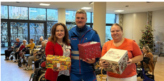
Sanitka splněných snů