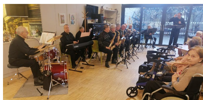
Big band Pražského salónního orchestru