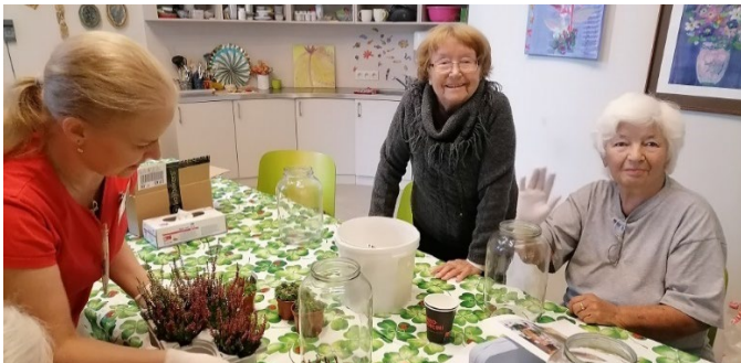
Zahrada ve sklenici