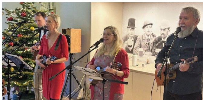
Koncert Ecce Uku