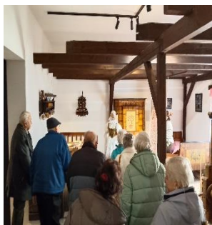
Návštěva Muzea Humpolec