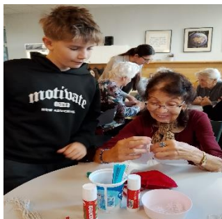
Návštěva klientů v ZŠ Questo