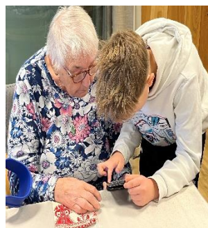
Projekt IT ZVESELA