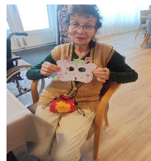
Výroba masek v Senevida Humpolec