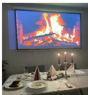
Večeře při svíčkách