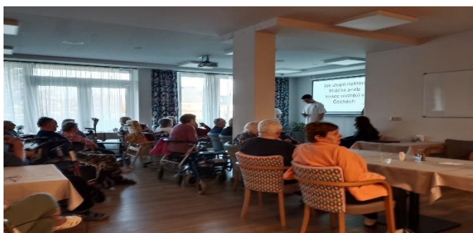
Přednáška od studentů ze SČMSD

V průběhu všech měsíců v našem Domově probíhají různorodé aktivizační programy. Aktivizační pracovnice si vždy na dané patro připraví týdenní plán aktivit rozvržený tak, aby obsahoval společné skupinové aktivity, individuální aktivity, pohybové aktivity, hudební programy a různá společná mezigenerační setkávání.