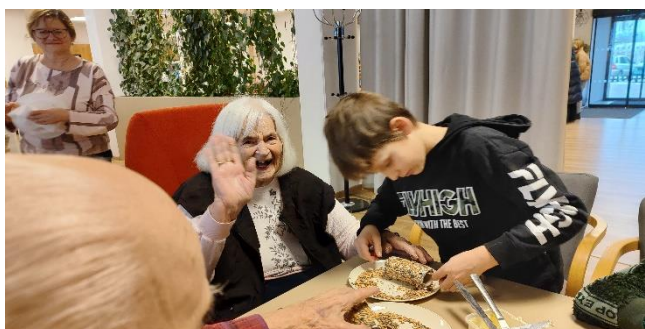
Návštěva dětí ze ZŠ Hálkova