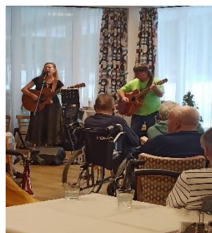
Hudební vystoupení skupiny Ty a My