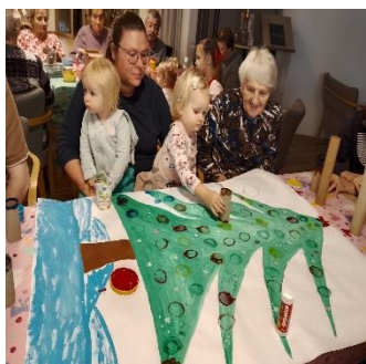
Dětská skupina Puntanela