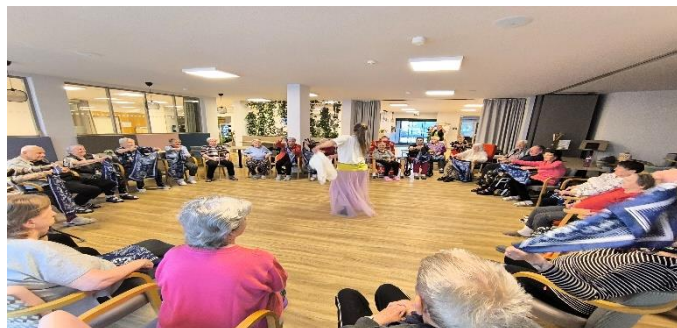
Taneční vystoupení - Puntanela