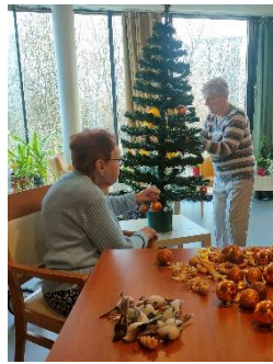
Zdobení stromečku na 3. patře