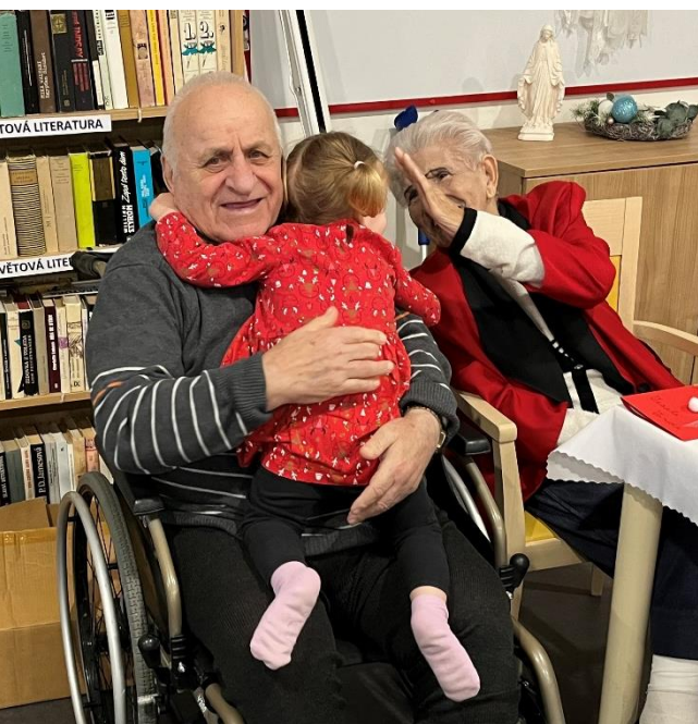
Dětská skupina Elánek