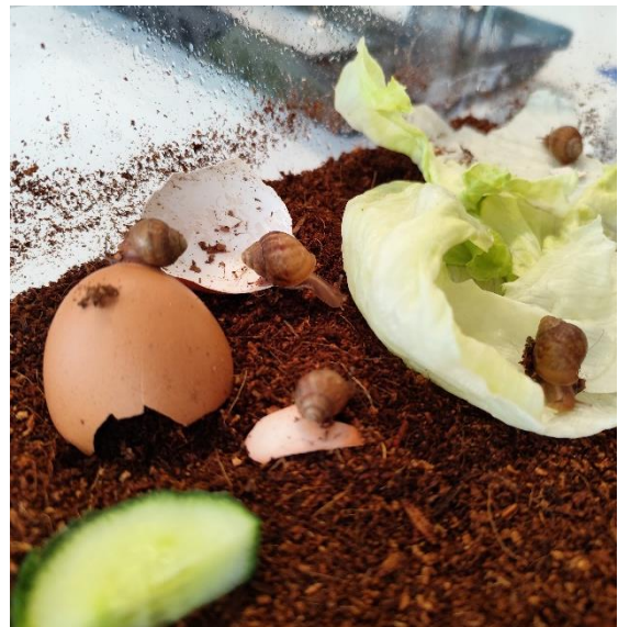
Naši domácí mazlíčci

Rádi je ukazujeme našim klientům, kteří si je mohou dokonce vzít na ruku a pozorovat, jak se pohybují. Šneci tak nejen obohacují naše prostředí, ale také přispívají k aktivizaci a terapii našich klientů.