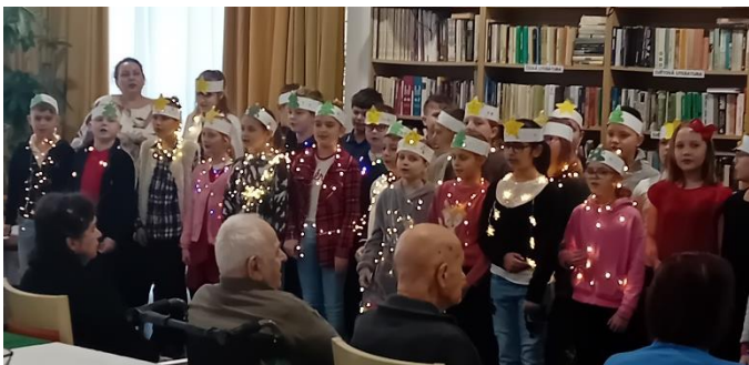
Vánoční vystoupení žáků ZŠ Moravská