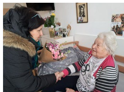
Gratulace ke 100.narozneninám