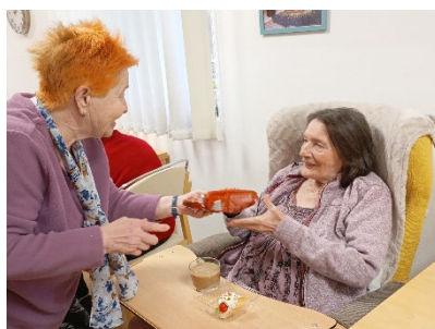
Gratulace od klientky