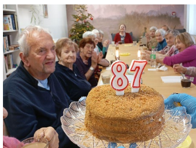
Dort nesmí chybět