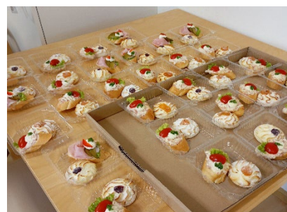
Dárek od rodiny pro klienty k oslavě