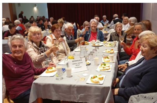
Setkání seniorů v kulturním centru