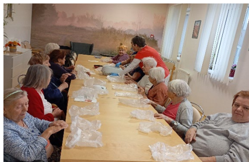
Aplikace parafínových zábalů