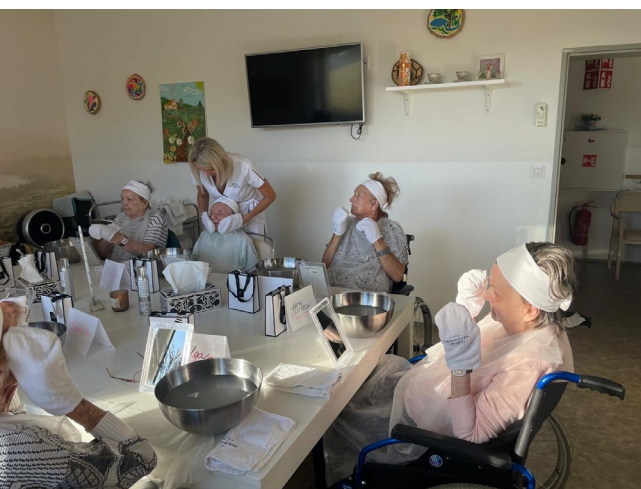
Voňavé a relaxační odpoledne