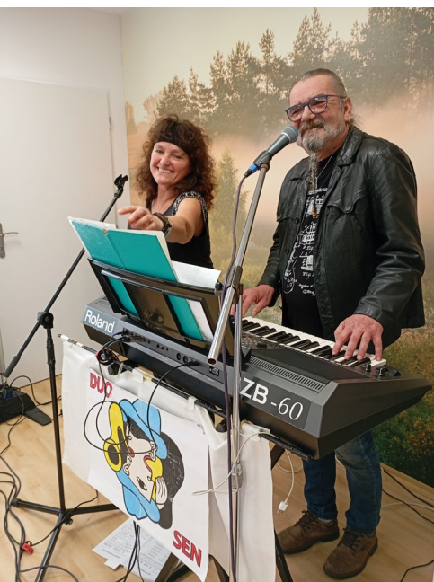
Hudební produkce DUO SEN