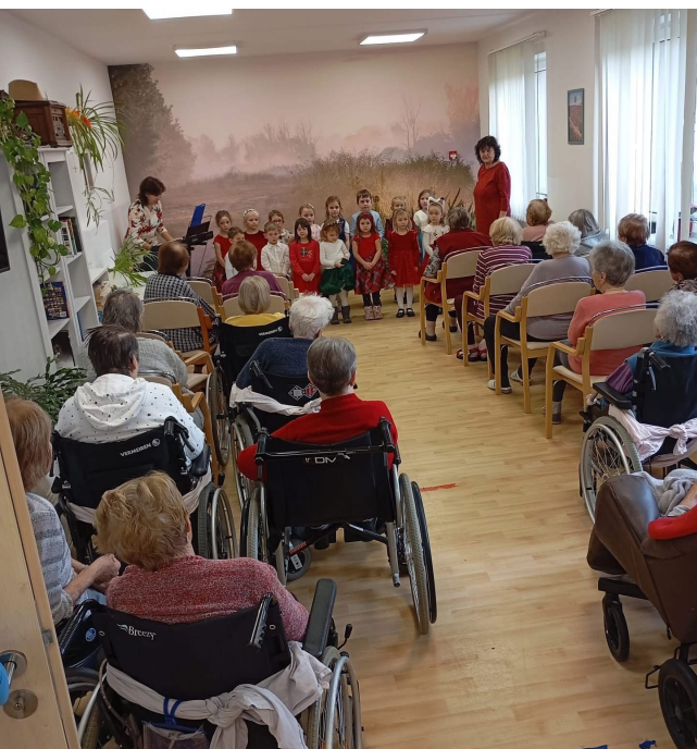
Návštěva dětí z MŠ Sluneční hodiny