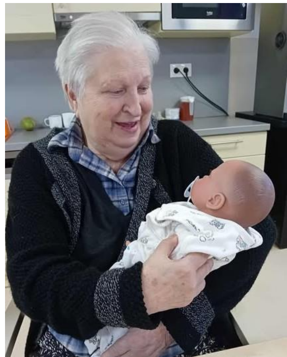
Vzpomínky na mateřství

Naši senioři jsou také rodičové, vychovávali své děti, vnoučata. Terapií pomocí terapeutických panenek dochází často také k rodičovské fixaci. Lidé vzpomínají na své rodiče a touží se s nimi setkat. Ve vzpomínkách se vrací do minulosti. Touto terapií naplňují své emocionální potřeby a cítí se klidnější a spokojenější.