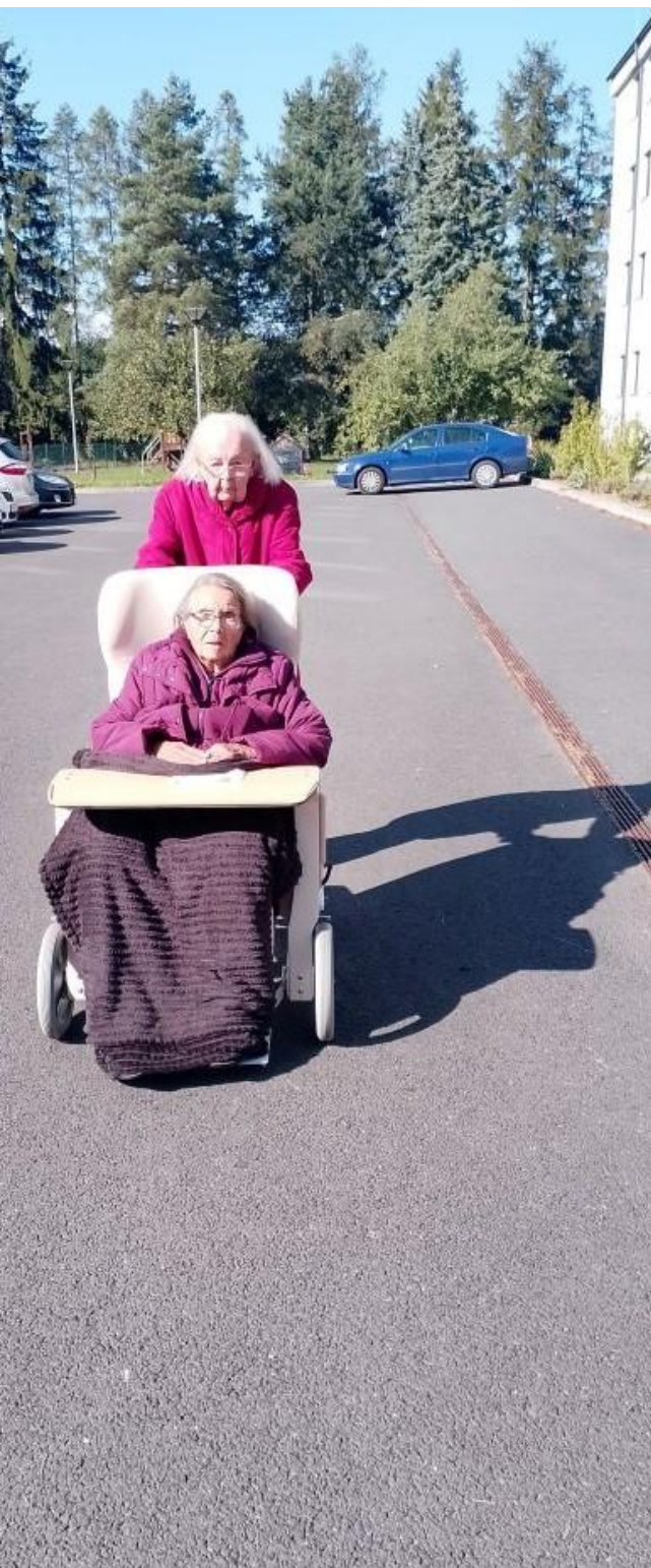
Na procházce s přítelkyní