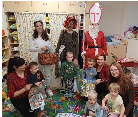
Děti se čerta nebojí

Svátek svatého Mikuláše přinesl jako obvykle zážitky a radost malým i velkým. Mikuláš s jeho družinou poctili svojí návštěvou jak obyvatele Domova, tak dětičky z dětské skupiny Myška.