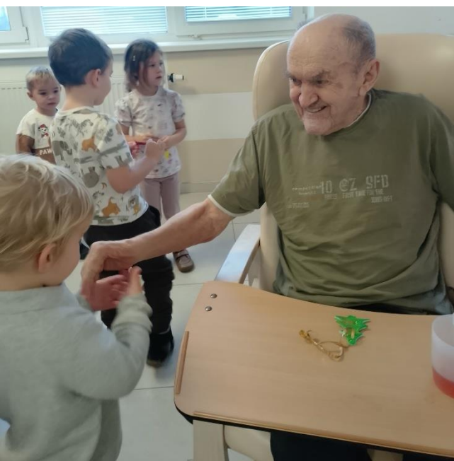
Radost ze života