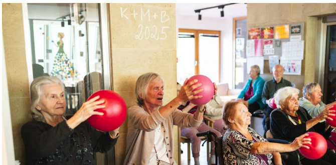
Pondělní cvičení s míči