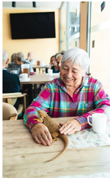
Terapie se zvířaty

Kontakt se zvířaty přináší klientům radost, pocit blízkosti a podporuje jejich psychickou pohodu. Často vytváří hezké momenty, které mají pro klienty i jejich blízké skutečný význam.