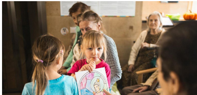
Dárky od nejmenších