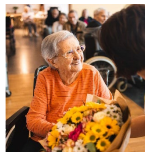
Oslava krásných 100 let