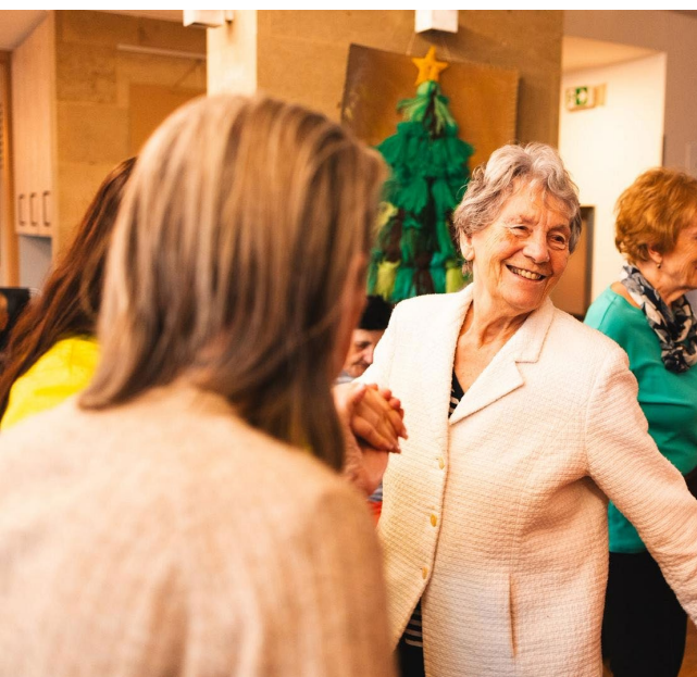
Odpoledne s hudbou