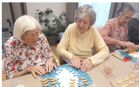
Pečení vánočního cukroví