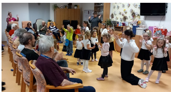
Vystoupení dětí z tanečního souboru Z.I.P.