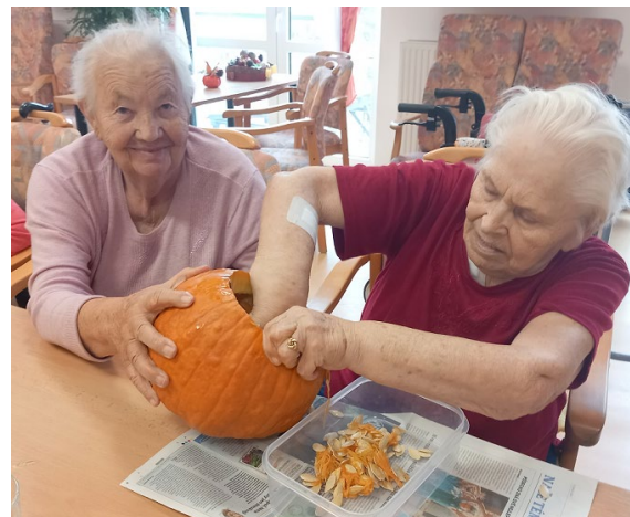
Pracovní nasazení při dlabání

Dlabání dýní není jen o přípravě na Dušičky nebo Halloween, ale především o společně stráveném času a procvičování jemné a hrubé motoriky. Úroda dýní na podzim byla veliká, ale senioři se nezalekli žádné výzvy. Každá dýně získala svou jedinečnou tvář a po vložení osvětlení vytvořili v domově útulnou atmosféru. Hotové výrobky ozdobily i vchod do budovy a udělaly radost návštěvám i kolemjdoucím. Tato akce opět potvrdila, že tvořivost nezná věk.