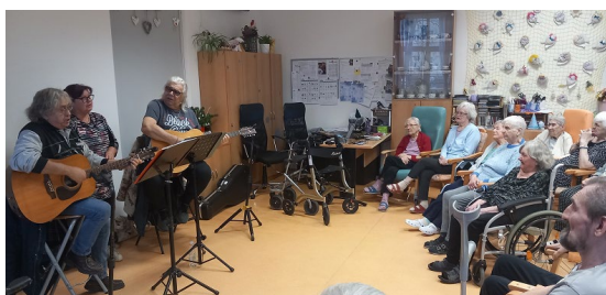
Vystoupení kapely Kamarádi z pískoviště