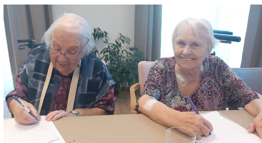
Paměťová cvičení a kvízy