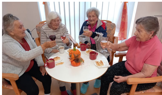
Ochutnávka svatomartinských vín