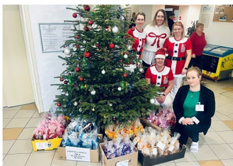
Dárky pro klienty od veřejnosti