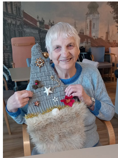
Vánoční tvoření skřítků

Důležitý ovšem není výsledek, ale radost z procesu a společné chvíle, které nám všem dávají energii.