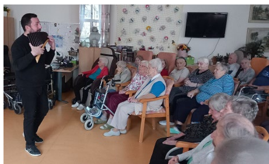
Hudební vystoupení panova flétna