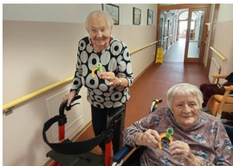
Hledání čokoládových podkov