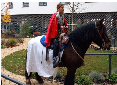
Příjezd sv. Martina