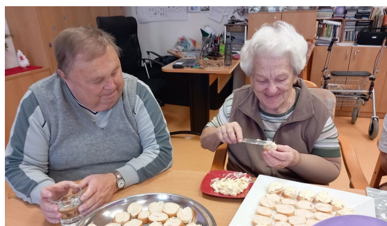
Příprava silvestrovského pohoštění