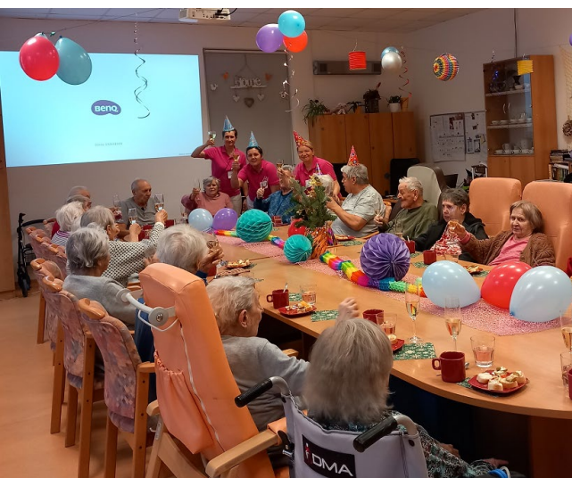
Klienti si připili na nový rok 2026