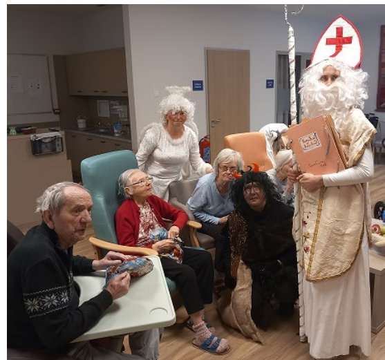
Vzácná návštěva sv. Mikuláš

Mikuláš obcházel jednotlivé pokoje a klienty v jídelnách, aby jim popřál klidný advent, anděl rozdával balíčky s ovocem a sladkostmi, zatímco čert se postaral o veselé strašení.