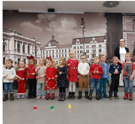
Dětské hlasy přinesly Vánoce

Společné zpívání známých vánočních písní propojilo generace a vytvořilo chvíle plné lidské blízkosti. Děkujeme malým účinkujícím i jejich pedagogům za krásný zážitek, který nám připomněl pravou podstatu Vánoc – sdílení, laskavost a radost ze společného setkání.