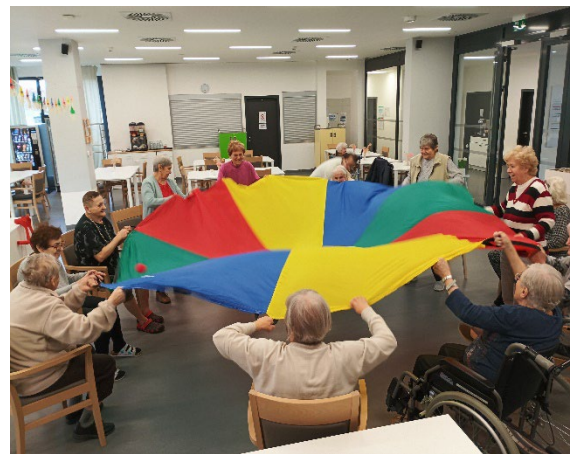
Společná koordinace pohybu

Klienti si společně vyzkoušeli pohybovou aktivitu zaměřenou na koordinaci, spolupráci a postřeh. V kruhu drželi barevné plátno s otvorem uprostřed a jejich úkolem bylo společnými silami udržet míč v pohybu a nasměrovat jej do středu. Cvičení vyžadovalo soustředění, vzájemnou komunikaci i jemnou motoriku. Aktivita přinesla nejen radost z pohybu, ale také posílila týmového ducha a podpořila přirozené sociální kontakty mezi klienty.