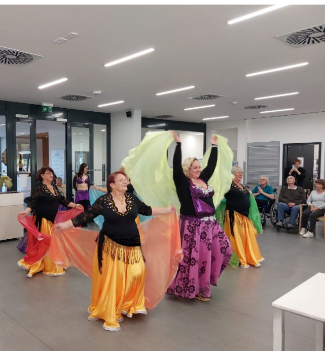
Tanec skupiny Aisha plný energie