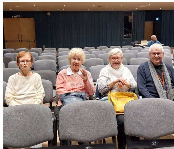
Klienti před zahájením v hledišti

Skupina klientů se zúčastnila zábavného talk show Léčba smíchem . Program nabídl vtipné vyprávění plné historek ze soukromého i profesního života protagonistů, glosy na aktuální témata a řadu vtipů, které přirozeně vtáhly publikum. Vystoupení přineslo uvolnění, radostnou atmosféru a sdílený zážitek, na který klienti dlouho vzpomínali.