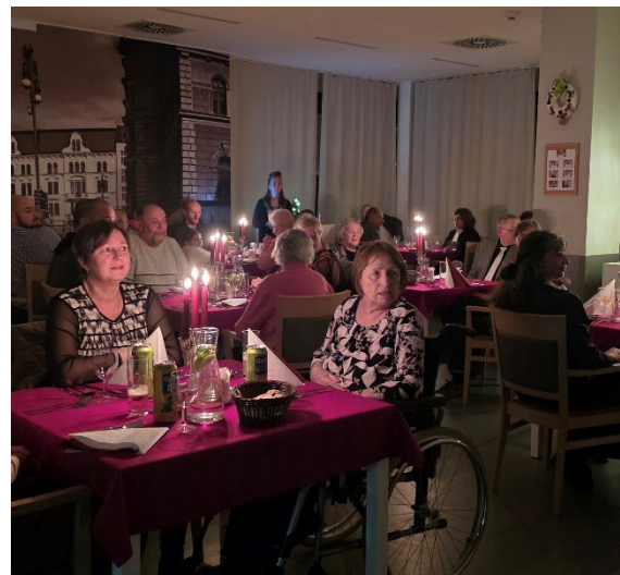
Společný večer s rodinami

Každoroční večeře při svíčkách patří mezi oblíbené společenské události našeho domova. Klienti a jejich rodiny se setkávají u slavnostně prostřených stolů, kde si mohou společně vychutnat připravené menu a strávit nerušený čas v příjemné atmosféře. Tlumené světlo svíček a klidné prostředí vytvářejí prostor pro rozhovory, sdílení vzpomínek i nové společné zážitky. Tento večer je symbolem blízkosti, rodinného propojení a lidské sounáležitosti.