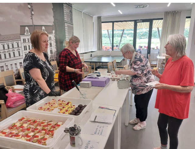
K výběru je plno zákusků