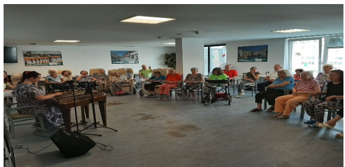
Hodina u cimbalu