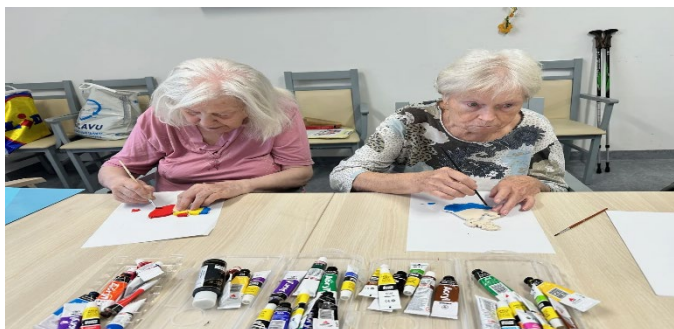
Tvoření dřevěných loutek