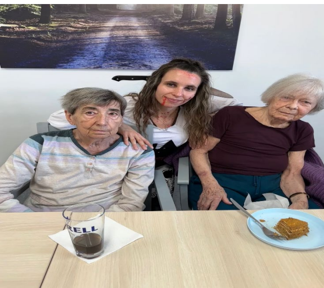
Oslava plná překvapení