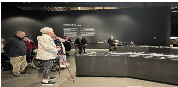
Výlet do dinosauria