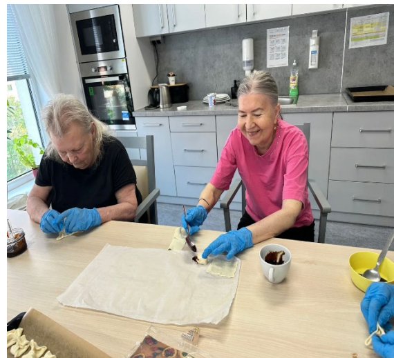
Zadělavání povidlových šátečků

Klientky se opět sešly, aby společně upekly tradiční povidlové šátečky z listového těsta. Každá dáma měla svůj úkol: některá s pečlivostí krájela listové těsto na úhledné čtverečky, jiná s lehkostí plnila střed hutnými, sladkými povidly. Všechny dámy s obratností přehýbaly rohy, aby vznikl dokonalý šáteček. Po krátké chvíli v troubě se na plechu objevily zlatavé, nadýchané šátečky!