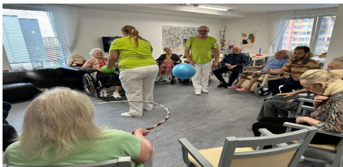
Společné cvičení + sportovní hry s míčem