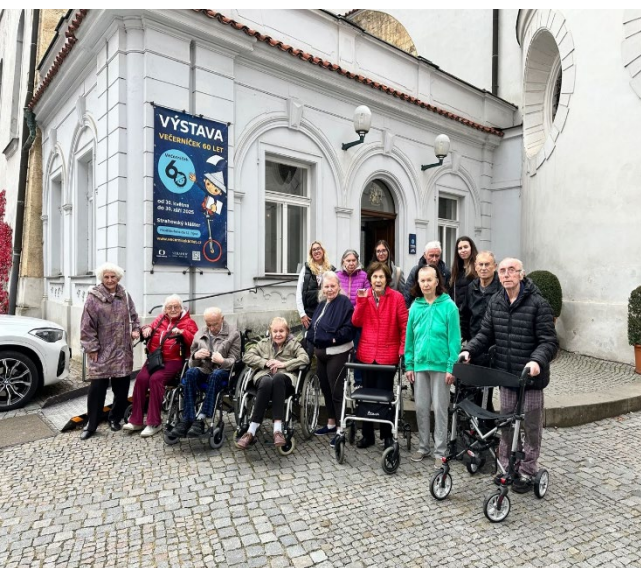
Společná fotografie z výletu