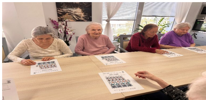
Procvičování kognitivních funkcí