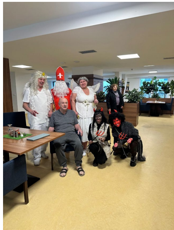
Společná fotografie na Mikulášské nadílce

V pátek Mikuláš s andělem a čertem navštívil i klienty domova SENEVIDA Jasmín. Zde se těšili radostnému setkání, protože nenašli snad žádné zlobivce. U nás v Jasmínu je to totiž samá hodná duše. Všichni tedy byli obdarováni sladkým balíčkem od Mikuláše a andělů, a čerti tak klientům přinesli z pekla štěstí a do pekla se vraceli s prázdnou.