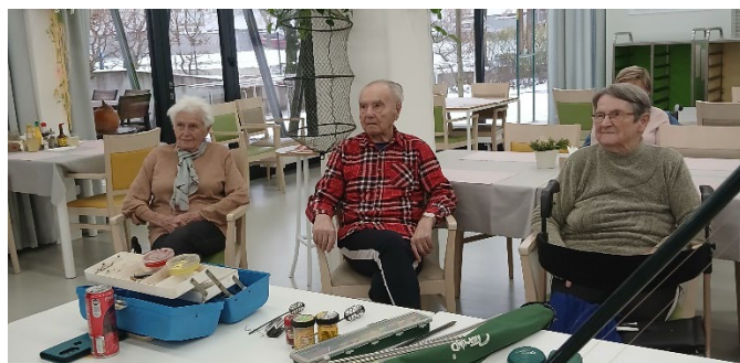
Přednáška o výlovu rybníků