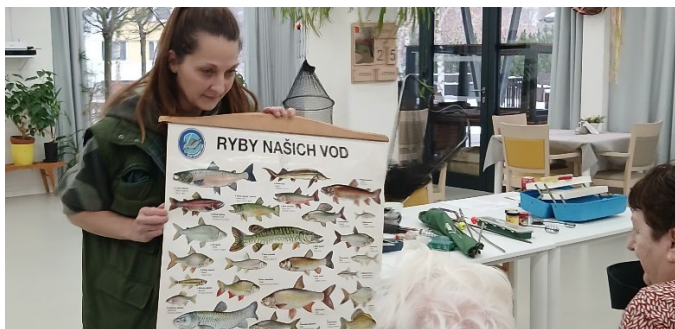
Přednáška o výlovu rybníků