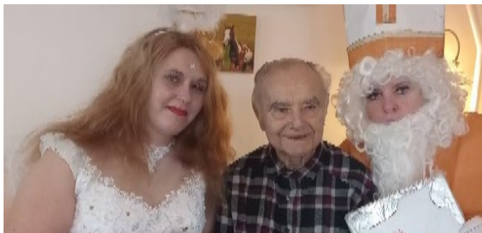
Návštěva Mikuláše a jeho družiny