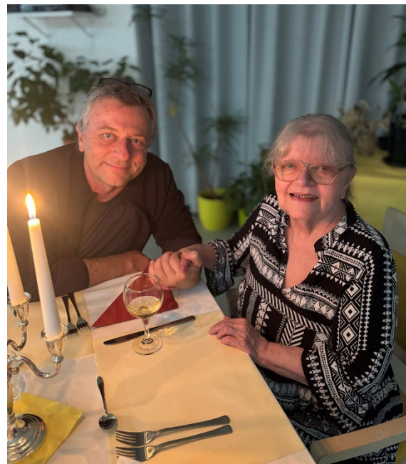
Setkání u večeře při svíčkách.

Na konci října 2025 proběhla v našem Domově akce Večeře při svíčkách. Ke svátečnímu stolu byli přizváni klienti a jejich nejbližší. Během slavnostního večera se podával předkrm parfait z kachního masa, polníček a koňakové brusinky, polévka jemný krém s liškami, bylinky a krutony, hlavní chod hovězí líčko, kořenová zelenina, černé pivo a bramborová kaše a večer završil dezert v podobě čokoládové pěny s višňovým gelem. Příjemný večer zastavil čas a spojil rodiny u výborného jídla a slavnostní atmosféry.