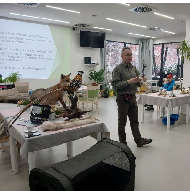
Přednáška na téma poslední leč