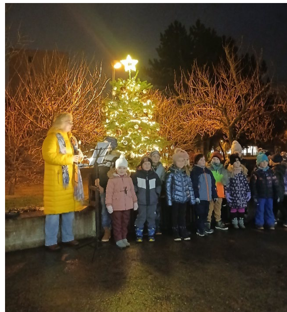
Děti z mateřské školky Sluníčko

Dne 1.12.2025 jsme v našem Domově zahájili čekání na Ježíška rozsvícením vánočního stroměčku. Tradice, která je v našem domově chvilku, ale o to víc nás spojuje. Už od začátku listopadu hledáme perfektní stromek, který společně s klienty ozdobíme. Velký dík patří naší kuchyni, která nám uvařila výborný svařák na zahřátí. Letos nám na rozsvícení zazpívali děti z MŠ Sluníčko, se kterými dlouhodobě spolupracujeme v rámci projektu Mezigeneračně.