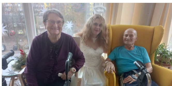
Návštěva Mikuláše a jeho družiny