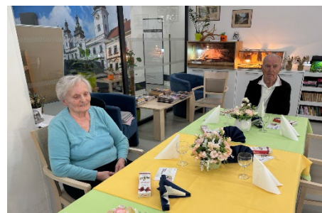
Oslava narozenin říjen