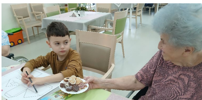
Vánoční tvoření s rodinami

V našem Domově se neustále něco děje, každý týden organizujeme společenské akce, které vybízejí k setkávání a společnému trávení času. Všechny zážitky pečlivě dokumentujeme, a proto se můžete podívat, jestli se nenajdete v následující fotogalerii momentek z našich akcí.