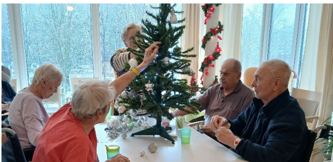
Zdobení vánočního stroměčku