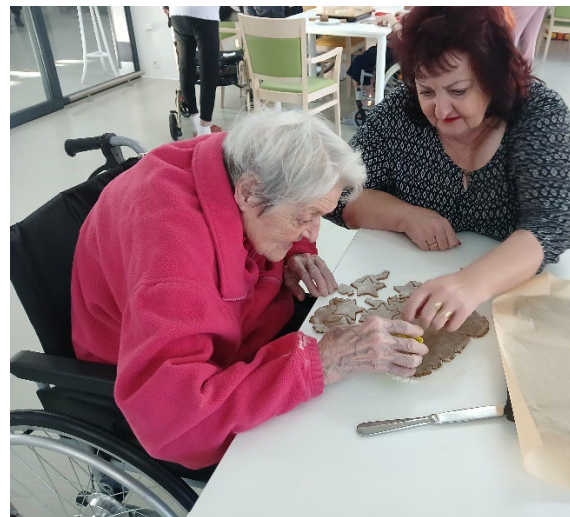
Společné vánoční pečení

Konec listopadu se nesl ve znamení příprav na nadcházející adventní čas. Rodiny našich klientů dostaly pozvání na společné tvoření, krásnou příležitost na zastavení se před vánočním shonem. V nabídce bylo pečení vánočního cukroví a drobné vánoční dílničky. Účast byla hojná a při společném tvoření nechyběl smích ani vánoční atmosféra, která nás všechny naladila na poslední měsíc v tomto roce.