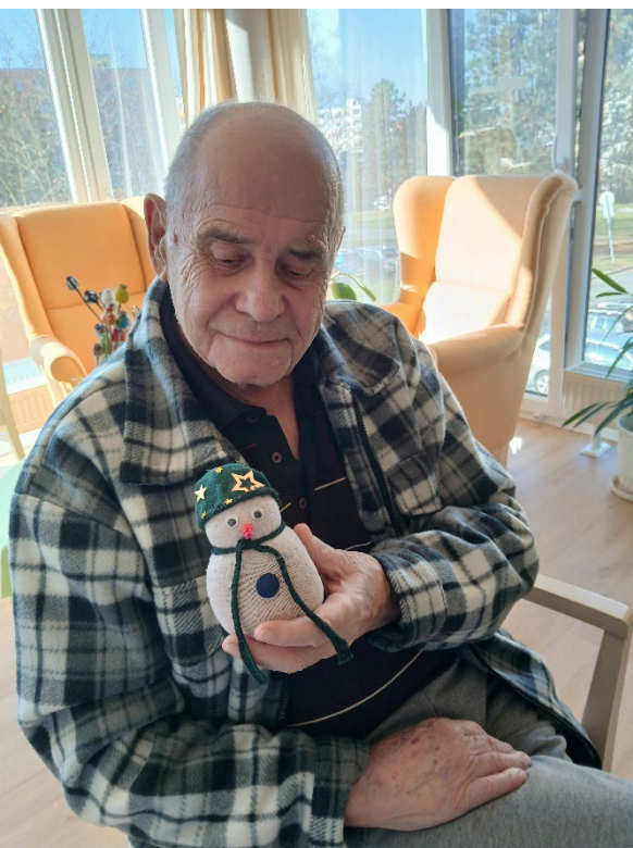
Hotový výrobek a jeho autor