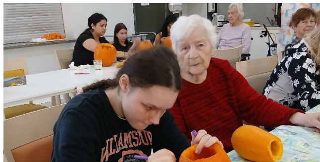
Dýňové tvoření se speciální základní školou