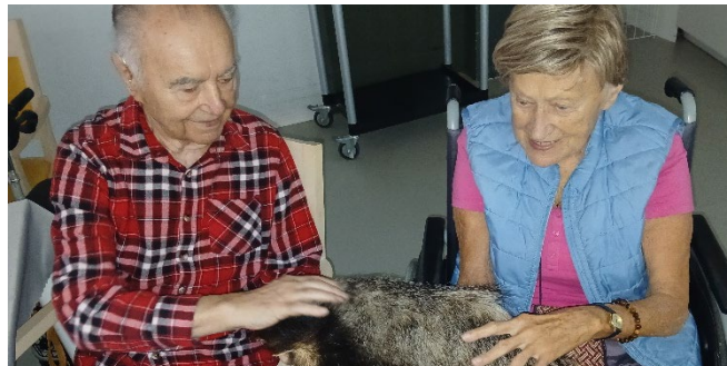
Ukázka z přednášky o myslivosti