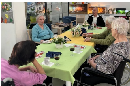
Oslava narozenin říjen