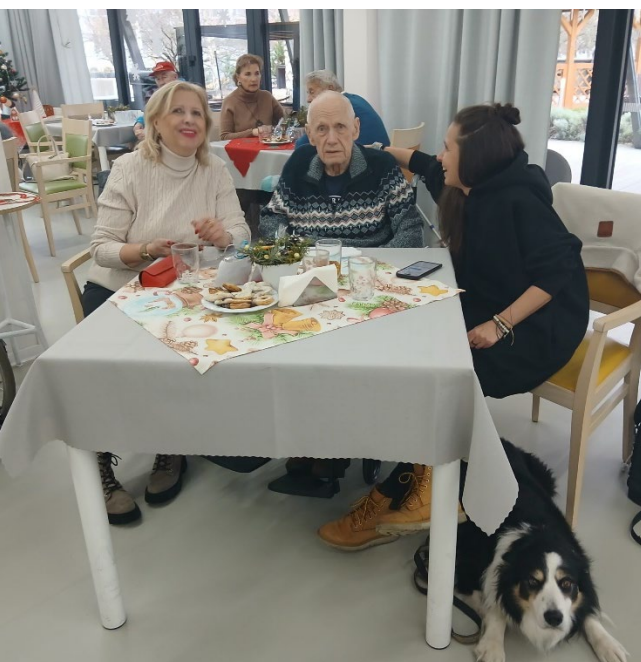
Vánoční posezení s rodinou