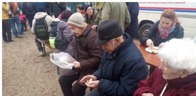
Výlet na výlov rybníka