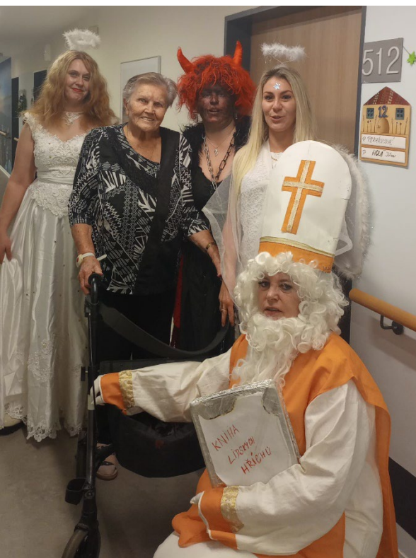
Návštěva Mikulášovy družiny