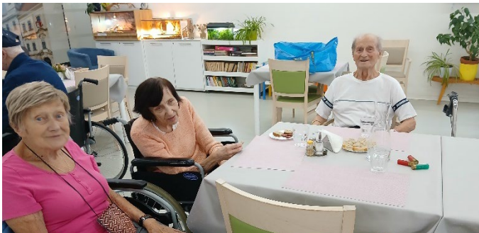
Posezení u gurmánské ochutnávky