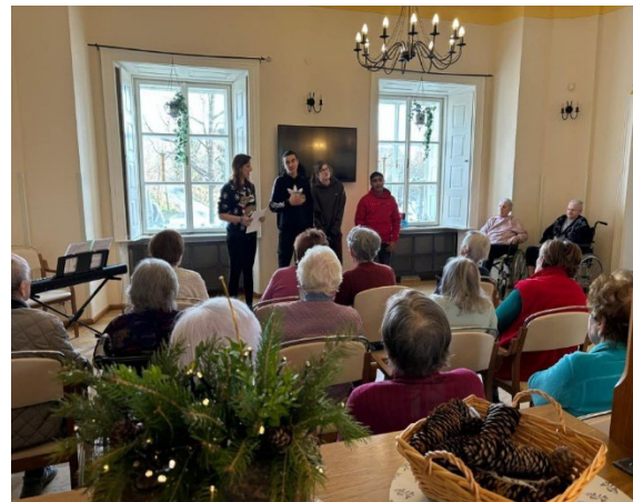
Návštěva dětí ZŠ Husova Čáslav

Navíc pro naše klienty vlastnoručně vyrobily krásná tematická přáníčka, která udělala obrovskou radost.