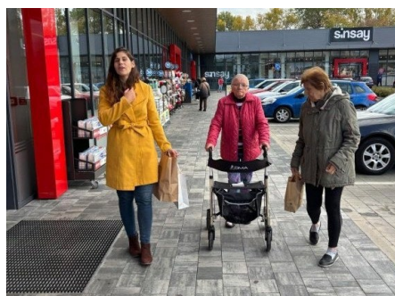
Výlet na nákupy