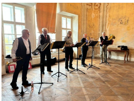
Hudební vystoupení žesťového souboru