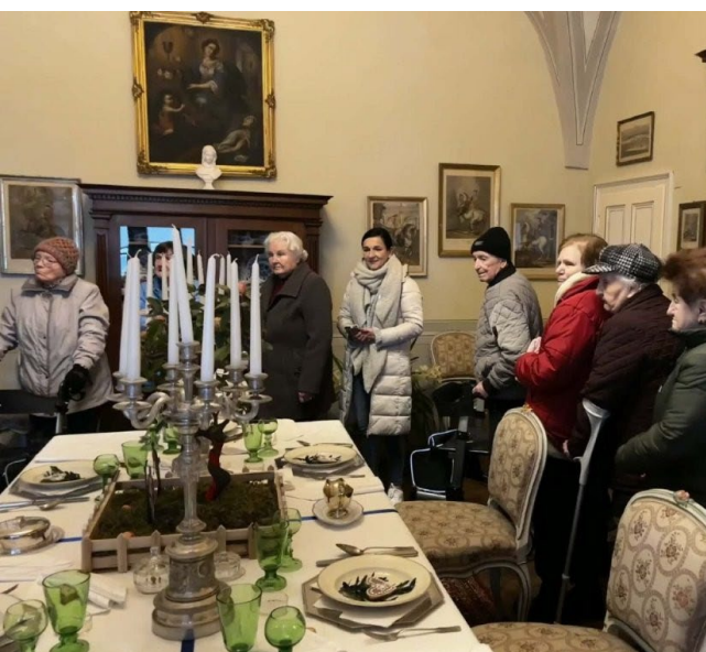
Výlet do Slatiňan