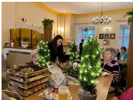
Výroba vánočních dekorací