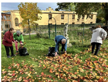
Společný podzimní úklid zahrady

Poslední měsíce letošního roku přinesly mnoho každodenních radostí i výzev. Společně jsme prožili řadu krásných okamžiků – oslavy narozenin, kulturní vystoupení, návštěvy, tvořivé dílny, vaření, pečení, soutěže, společná setkání i chvíle klidného sdílení. Na střípky s prožitých dnů se může podívat v této galerii.