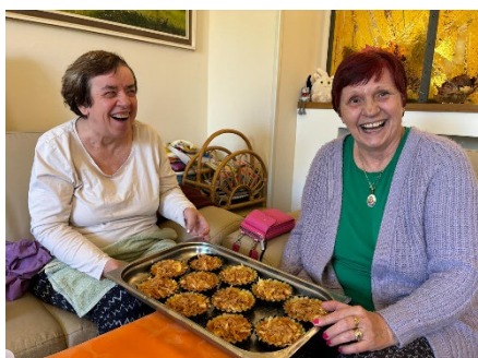
Pečení dýňových koláčů