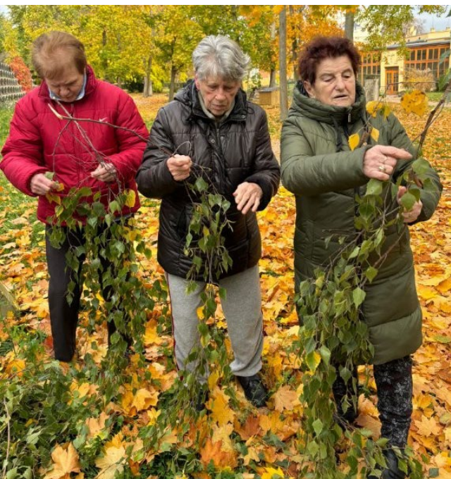
Podzimní zahrada ve Filipově