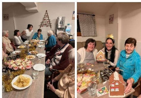
Vítání nového roku