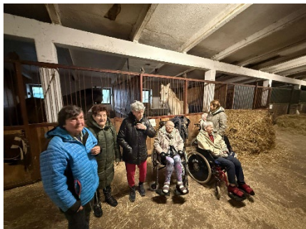
Procházka ke koním