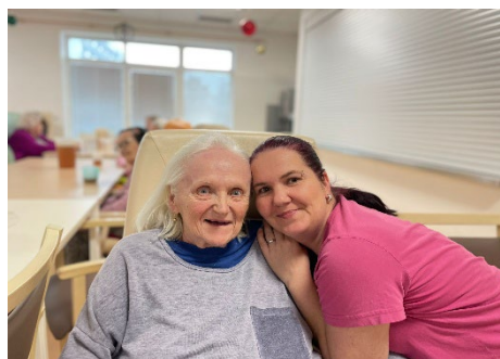
Vystoupení kapely Fidle Fizz