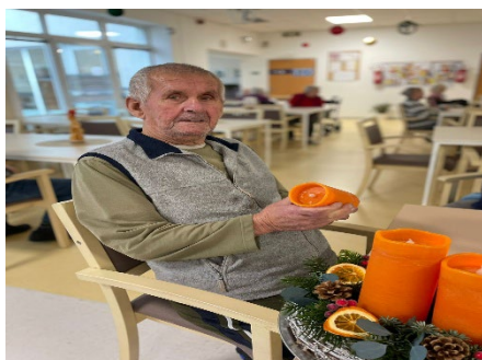
Rozsvícení třetí adventní svíce