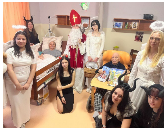
Mikuláš, čert a anděl

V prosinci proběhla v našem Domově Mikulášská nadílka ve spolupráci se studenty ze zdravotní školy. Mladí návštěvníci přinesli nejen nadílku, ale především dobrou náladu a úsměvy.