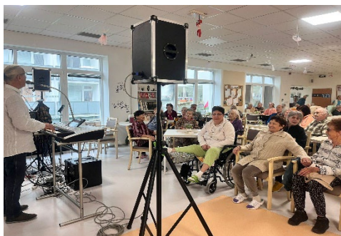
Vystoupení skupiny Domino

Níže přinášíme několik fotografií z uplynulého čtvrtletí