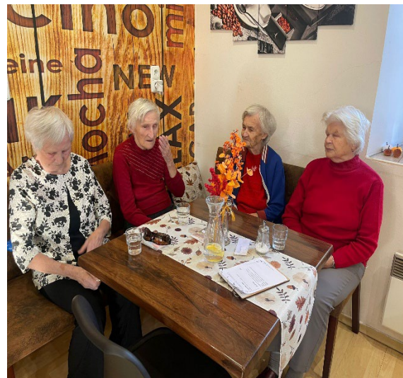
Kavárna Kafe Laky

Setkání proběhlo v přátelské atmosféře a klienti si pochvalovali nejen výborné dobroty, ale také možnost strávit čas mimo Domov a společně si popovídat. Výlet do kavárny byl pro všechny milým zpestřením dne.