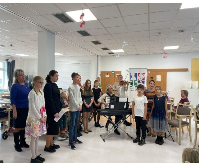
Koncert žáků ZUŠ Česká Lípa