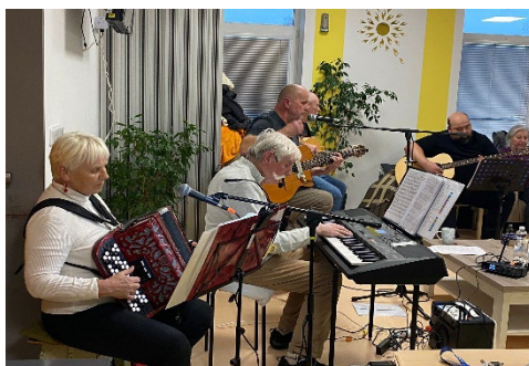
Vystoupení kapely Klídek Band